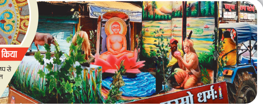
सरकंडा से क्रांति नगर मंदिर तक शोभायात्रा

वन्देमातरम मित्र मंडल ने स्वागत किया महावीर जन्म कल्याणक पर निकली शोभायात्रा का पुष्प से स्वागत एवं ठंडे पदार्थ का वितरण वंदे मातरम मित्र मंडल के सदस्यों के द्वारा बस स्टैंड चौक में किया गया। स्थानकवासी जैन संघ टिकरापारा में प्रभात फेरी, श्री दशा श्रीमाली स्थानकवासी जैन संघ टिकरापारा के द्वारा महावीर जन्म कल्याणक महोत्सव बहुत ही धूमधाम से मनाया गया। जिसमें प्रातः काल 6:30 बजे प्रभात फेरी निकाली गई, जिसमें समाज के सभी श्रावक श्राविका एवं बालक बालिकाओं ने बंद-बंदकर हर्षोल्लास के साथ भगवान महावीर स्वामी के जय जयकार करते हुए टिकरापारा जैन भवन से मन्व चौक, दयालबंद, जन्माल चौक होते हुए पुनः जैन भवन में आकर प्रभात फेरी संपन्न हुई।