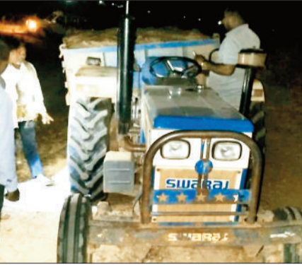
अवैध रेत परिवहन के दौरान घाट पर इसी ट्रैक्टर से गिरा था मृतक।