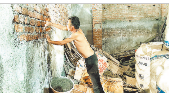
इसी दीवार से होकर गोदाम में घुसा था आरोपी।

बिलासपुर। बीती रात गोदाम में सेंधमारी कर चोरी करने घुसे युवक को मालिक ने पकड़कर पुलिस के हवाले कर दिया है। पुलिस ने उसे गिरफ्तार कर लिया है। आरोपी।