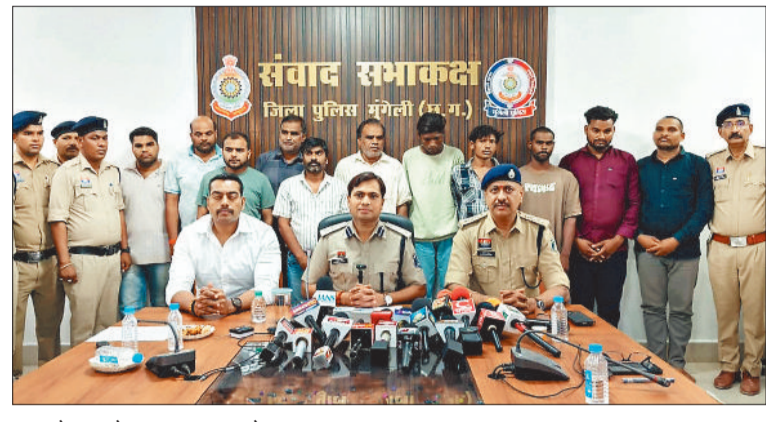
हत्या के मामले का खुलासा करते अफसर।

ग्राम मनोहरपुर से सेवानिवृत्त लेखापाल की अपहरण कराकर हत्या करने वाले 11 आरोपियों सहित 4 नाबालिग को पुलिस ने गिरफ्तार किया है। मृतक के सगे भाई व परिजन ही हत्या के मास्टरमाइंड, संपत्ति हड़पने के उद्देश्य से बाप बेटे में दुश्मनी कराकर सुपारी देकर अपहरण कर हत्या कराने एवं आरोपियों से सेवानिवृत्त लेखापाल को बेटे से खतरा बताकर करोड़ों की संपत्ति को अपने नाम कराने का षड्यंत्र का पुलिस ने खुलासा किया है। आरोपियों में एक कांग्रेस के पूर्व एलडरमेन रह चुका है।